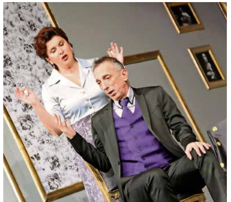
Tri priče u jednoj noći

- Ljudska imaginacija je neograničena i zaista su joj svi putevi otvoreni, bilo neposredno, bilo posredstvom tehnologije. Od kada je prvi čovjek ostvario kontakt sa drugim čovjekom, imao je urođenu potrebu da se izrazi kroz naraciju i da od prvog alata napravi prve lutkice i postavi prvu predstavu, kako bi pojasnio sebi svijet koji ga okružuje. Bez jezika, bez pisma, bez države, bez čega što podrazumijevamo pod pojmom civilizacija. Sjedili su prvi ljudi kraj vatre i igrali svoje tadašnje igrice. Pričali priče. Umjesto telefona, imali su drvo i kamen. Pravili su prve skulpture, kostime i izvodili prve predstave, pričajući prve priče. Pričanje priča je naš posao. I obaveza naše profesije.