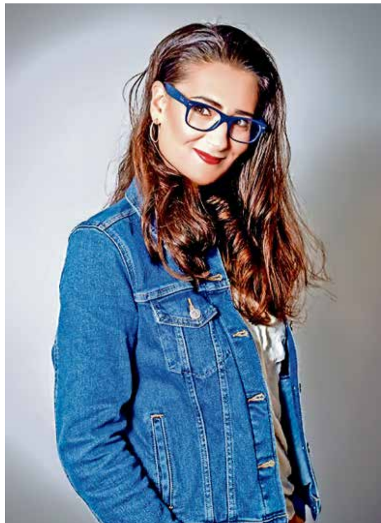
Panjeta: Ljudska imaginacija je neograničena

U narednom periodu planiramo i saradnju sa Turskom, te mi se čini da se pozorište neintencirano internacionalizira i otvara u nove tokove multimedijalnih umjetnosti koje kroz klasične naracije i obrasce pružaju edukaciju i zabavu djeci i roditeljima zajedno. Jedna od prvih predstava kojom je započela ova